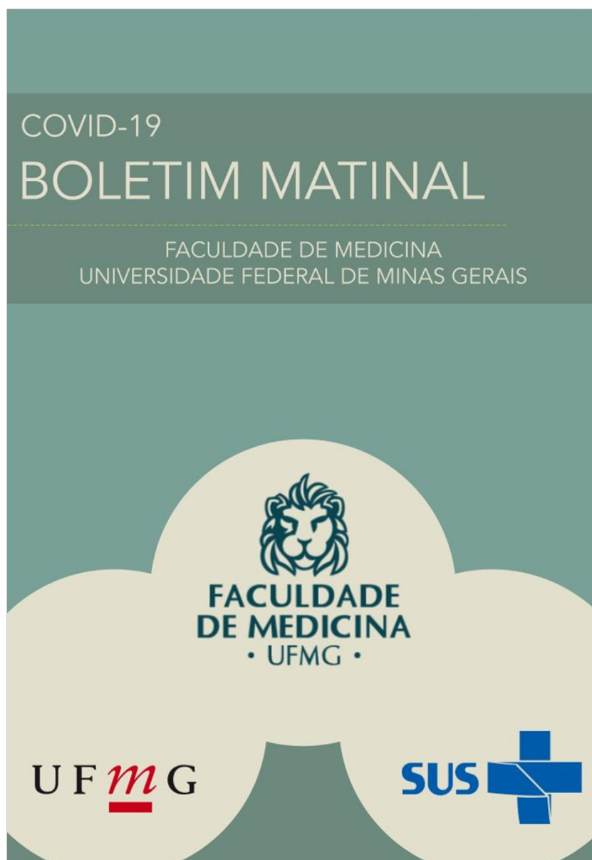
Figura 1 - Imagen de portada del boletín matutino

El objetivo fue producir, inicialmente de forma diaria, un boletín con resúmenes de artículos científicos recientes, datos epidemiológicos actualizados y noticias de Brasil y del mundo y difundirlo en las redes sociales. El contenido es seleccionado por profesores y resumido por estudiantes de medicina que participan en el proyecto. El lenguaje es accesible y los textos están elaborados de manera sucinta para que la lectura sea fácil, rápida y brinde información relevante para el público lego y los profesionales de la