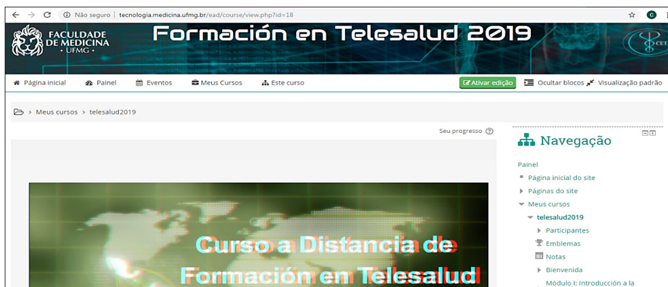
Figura 1. Plataforma del curso de Formación en Telesalud.